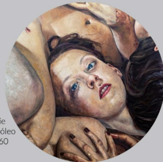
Sin título II [De la serie El desayuno] (2018), óleo sobre lienzo, 160 x 160 cm.