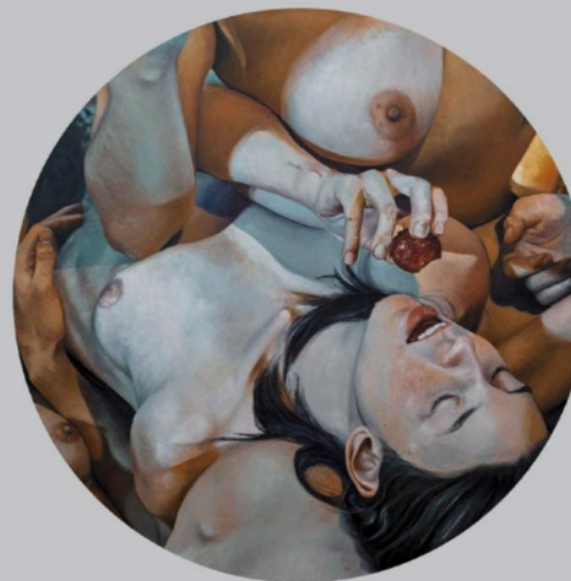
Sin título III (fresa) [De la serie El desayuno] (2019), óleo sobre lienzo, 160 x 160 cm.