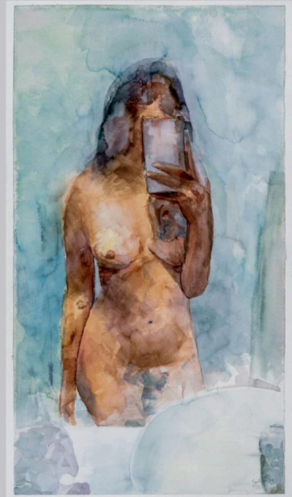
A. A. II (2019), gouache sobre papel, 60 x 35 cm.